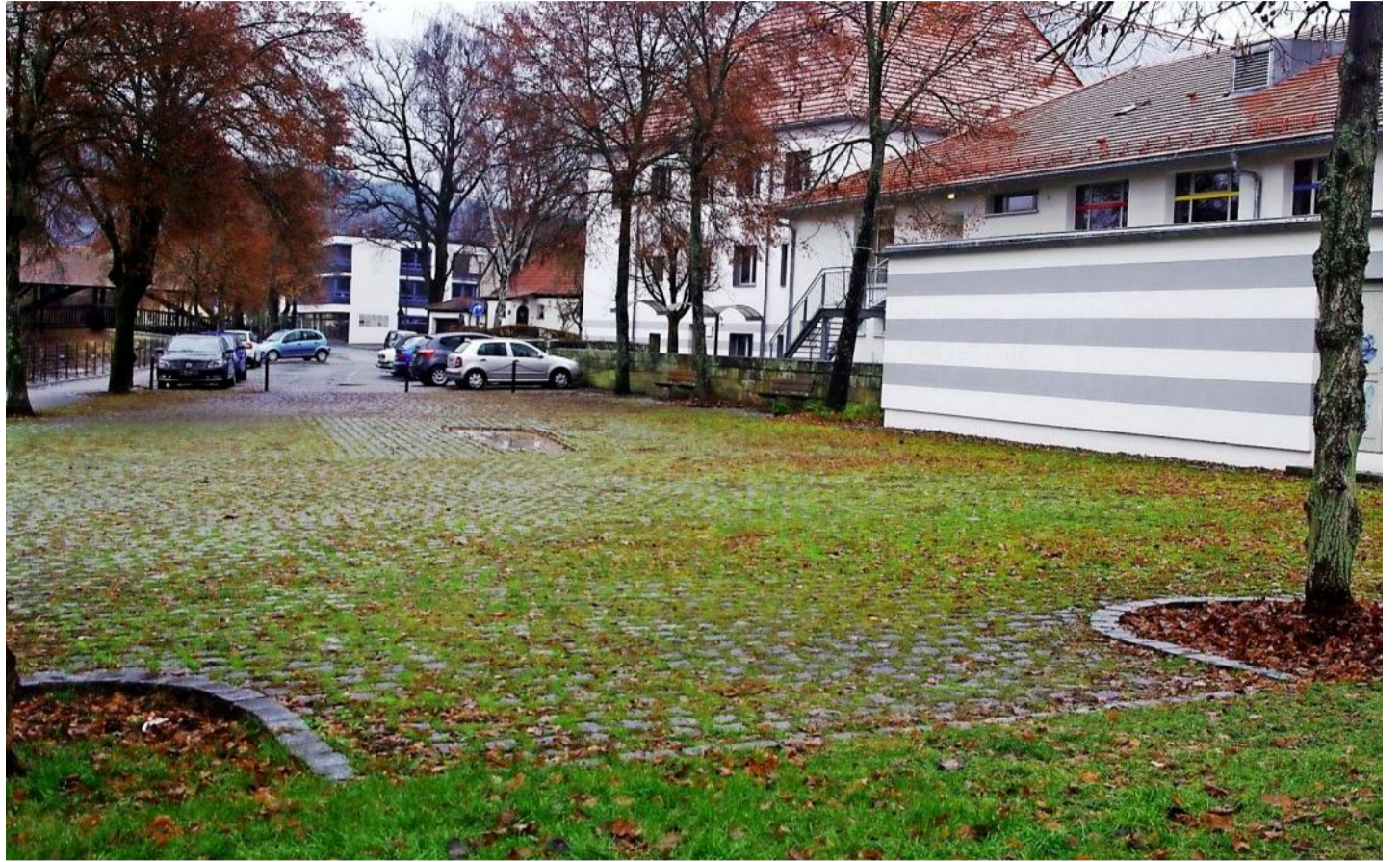
Die Kronach-Allee soll zur „Traum-Allee“ werden. Mit Unterstützung von Rosi Ross ist im „Mädchen-Café“ eine anschauliche Entwurfsskizze entstanden, wie der „Lieblingsplatz“ mit Überdachung, Floß, Trampolin und Sitzgelegenheiten gestaltet werden soll.

Zur Gestaltung des Lieblingsplatzes wurden bislang viele Gedanken und Ideen im „Mädchen-Café“ entwickelt. Diese Überlegungen haben die Schüle-