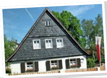
Flößerkirchweih: Wie das Brauchtum in Unterrodach unter Corona leidet MITTENDRIN, SEITE 16